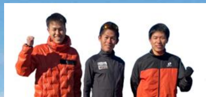
Kawauchi Cup Kurihashi Sekisho Marathon