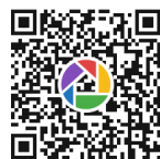
■大会ホームページ